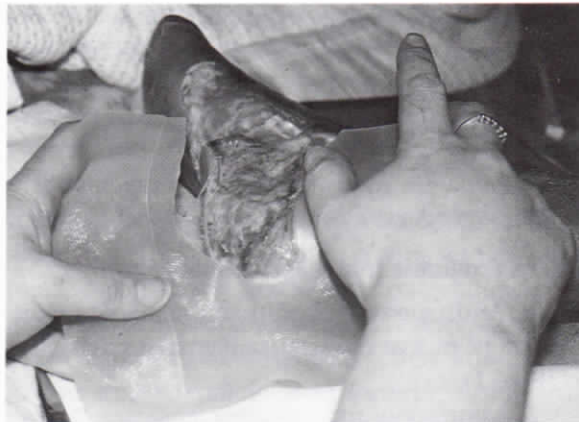
Εικ. 3. Εφαρμογή υδροκολλοειδούς υλικού.