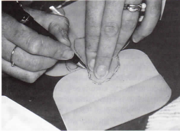
Εικ. 2. Απότύπωση περιγράμματος έλκους σε φύλλο υδροκολλοειδούς υλικού.