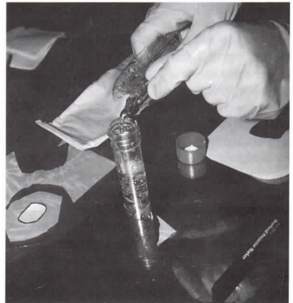
Εικ. 5. Εμπλουτισμός προνύμφών με φυσιολογικό ορό.

Αυτή η διαδικασία εξυπηρετεί δύο σκοπούς, γιατί το υδροκολλοειδές εξασφαλίζει μια βαθειά βάση για το δεύτερο σύστημα επίδεσης (πλέγμα και προνύμφες), με αποτέλεσμα επαρκή χώρο για τις προνύμφες, που σύντομα θα απαιτήσουν περισσότερο χώρο, και επί πλέον εξασφαλίζεται η ακεραιότητα του υγιούς ιστού που περιβάλλει το έλκος από τα πρωτεολυτικά ένζυμα, τα οποία παράγουν οι προνύμφες.