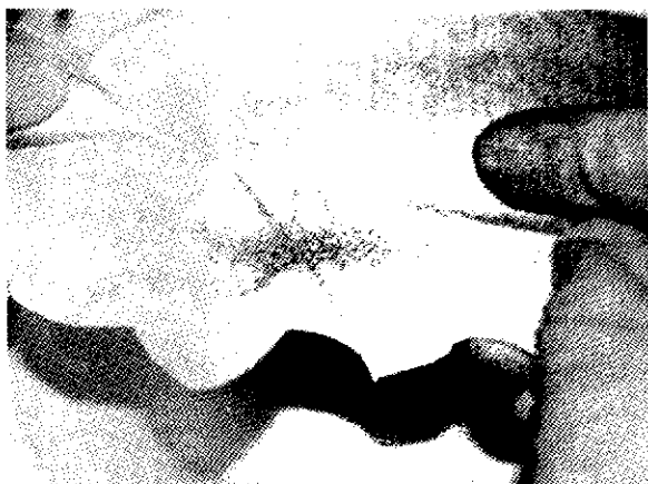
Εικ. 6. Απομάκρυνση φυσιολογικού ορού με τη βοήθεια αποστειρωμένου πλαστικού πλέγματος.