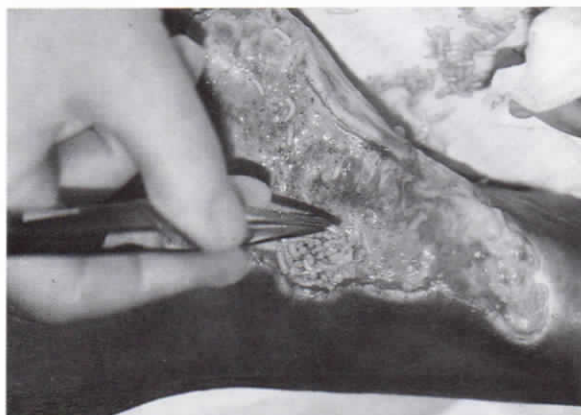
Εικ. 11. Απομάκρυνση προνυμφών με χειρουργική λαβίδα.