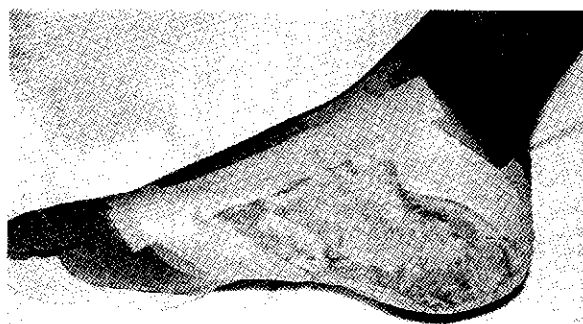
Εικ. 8. Σταθεροποίηση με επικολλητικές ταινίες.

Σε μερικά περιστατικά ίσως δεν είναι δυνατόν να τοποθετηθεί το υδροκολλοειδές ντύσιμο εξ αιτίας της θέσης του έλκους, ή λόγω υπερευαισθησίας του υγιούς δέρματος γύρω από το έλκος. Εδώ η τοποθέτηση μιας ειδικής «πάστας» ψευδαργύρου μπορεί να εξασφαλίσει ένα σίγουρο φράγμα στις προνύμφες, που ενδεχομένως θα αποπειραθούν να αποδράσουν από τον περιορισμένο χώρο τους. Φυσικά, το πιο πιθανό είναι ότι οι προνύμφες δεν θα προσπαθήσουν να εγκαταλείψουν ένα «χώρο ευημερίας» ιδανικό για την ανάπτυξή τους, μέχρι να φθάσει το τέλος της τρί-