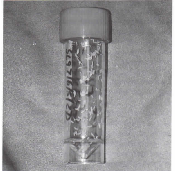
Εικ. 4. Φιαλίδιο που περιέχει προνύμφες.

4. Το σύνολο καλύπτεται με ένα απλό απορροφητικό επίθεμα με σκοπό να συγκρατούνται εκκρίματα ή ρευστοποιημένοι νεκρωμένοι ιστοί.