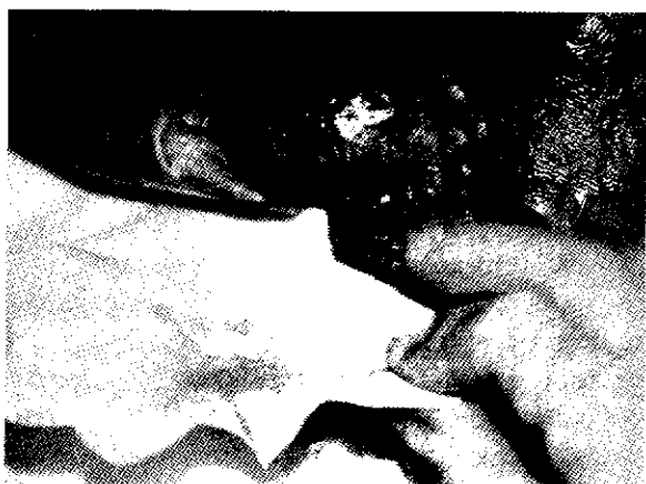
Εικ. 7. Μεταφορά και εφαρμογή προνυμφών στην περιοχή της βλάβης.

Για πρακτικούς λόγους είναι προτιμότερο να εισαγάγει κανείς τις προνύμφες μέσα στο έλκος αμέσως μετά την εφαρμογή του υδροκολλοειδούς υλικού και πριν την εφαρμογή του πλέγματος και την τελική απομόνωσή τους.