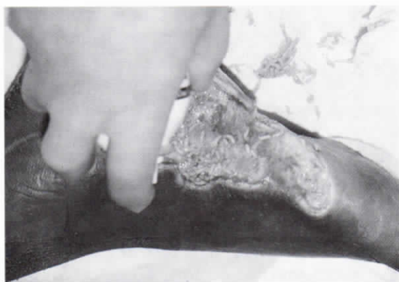
Εικ. 10. Απομάκρυνση προνυμφών με spray φυσιολογικού ορού.

Σε πολλές περιπτώσεις κρίνεται ικανοποιητική η απλή «εφ' άπαξ» εφαρμογή προνυμφών, αλλά για ιδιαίτερα εκτεταμένα έλκη απαιτούνται αρκετές επαναλήψεις για κάποιο αριθμό εβδομάδων.