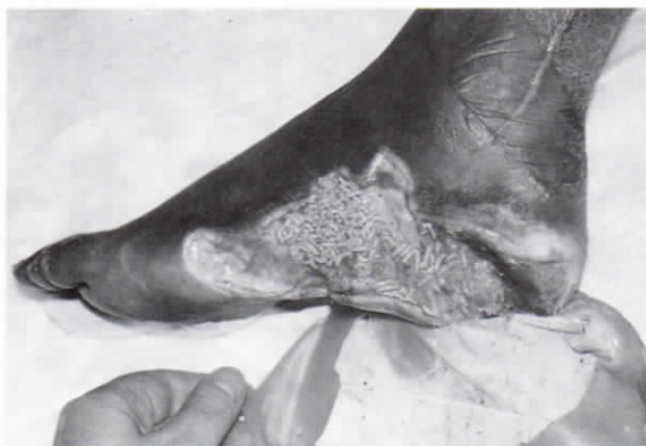
Εικ. 9. Απομάκρυνση του πλέγματος με τις ώριμες προνύμφες.